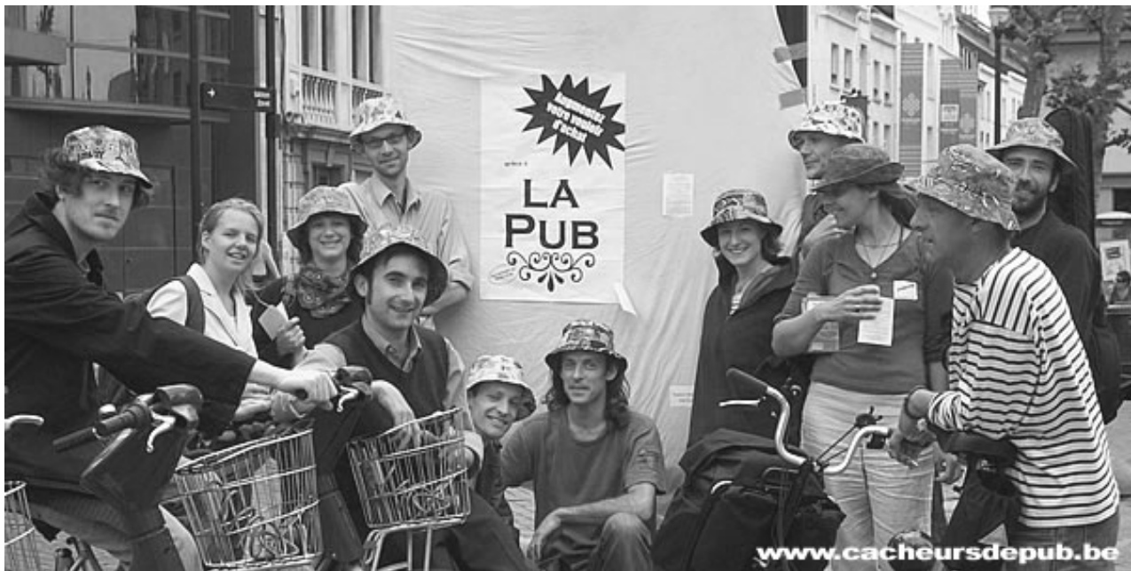
Les activistes du Collectif Cacheurs de pub (presque) au complet, après l'action du 24 mai, place de la Chapelle

Face à l'invasion publicitaire et à la passivité des pouvoirs publics, nous bougeons : nous cachons la pub. La publicité commerciale (message dont le but final est de vendre un produit, un service ou une marque) sert des intérêts privés, a recours à des techniques de manipulation avancée, impose ses messages à tous et tout le temps. La « pub » s'insinue partout : dans la rue, sur les bus, à la télé, à la radio, au cinéma, sur votre table au restaurant, sur vos vêtements, dans les journaux, sur Internet, dans les jeux vidéos, etc. En Belgique, on estime que chaque personne est impactée jusqu'à 15.000 fois par jour par des messages commerciaux, qui matraquent sans relâche l'idéologie du « bonheur par la consommation ».