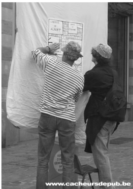
Les emballateurs emballent, décoorent...

Sur place, l'emballage débute. Un premier panneau sur le carrefour en face de la friterie (qui sert les touristes en masse) est recouvert d'un drap blanc. Les passants assistent à la scène sans trop s'en étonner. Le groupe est joyeux, un joueur de banjo anime l'action d'une ambiance celtique. La police est absente, les émissaires des diffuseurs aussi.