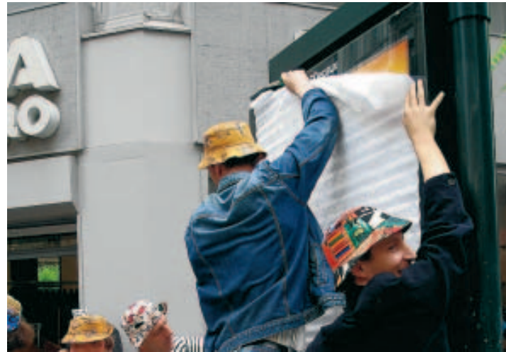
Le collectif en action, en juin dernier.

C'est la troisième action non violente de ce type à Bruxelles. La dernière en date, en juin (le mois de juillet n'ayant exceptionnellement pas connu d'opération en raison de vacances), avait rassemblé une trentaine de personnes. «